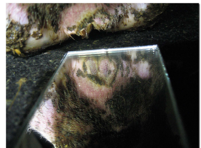
Figure 1. La visibilité de la lésion de DD est améliorée par l'utilisation d'un miroir et d'une lampe frontale puissante